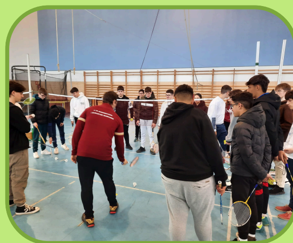
IES ENRIQUE DÍEZ CANEDO (PUEBLA DE LA CALZADA) – CLUB DEPORTIVO BÁDMINTON CIUDAD DE BADAJOZ